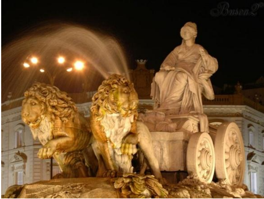
İspanya Madrid'teki Kibele Çeşmesi

Kybele kültü, Roma'ya girmeden önce Yunanistan'da yayılır ancak kanlı ritüellerinden dolayı aşağı bir konuma itilir. Yunan dünyasında Kybele'nin karakteri biraz daha değişir ve buraya hem Aphrodite hem de Artemis olarak geçer. Tapınağının bulunduğu Atina'daki resmî arşivlerde, Mısır'daki Maat ve Sümer'deki İnanna'da olduğu gibi, Kibele'ye de adalet imajının atfedildiği görülür. Kibele, Anadolu'dan Mezopotamya'ya, Suriye, Lübnan ve Filistin'e, Ege adalarıyla Girit'e kadar bütün Akdeniz kıyılarını kapladığı gibi, Yunanistan ve İtalya'da da yayılır, ayrıca kuzeyde İskandinav ülkelerine dek sokularak iz bırakır (4).