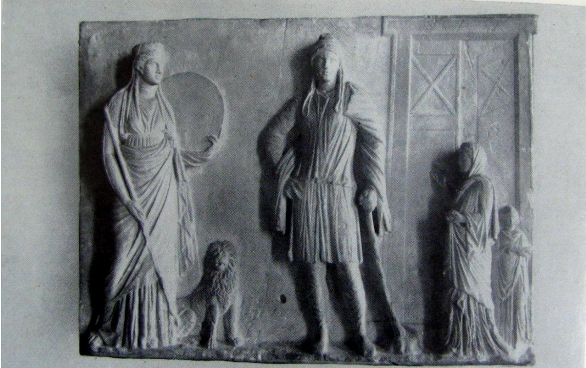
Magna Mater, aslan ve Attis'i tapınak hizmetkârları ile birlikte gösteren kabartma, M.Ö. 2. yüzyıl (Vermaseren, 1966: Plate XII-1)

Tanrıça, Attis (Agdistis) adında bir delikanlıya tutkundur. Onu, Pessinus kralının (kimi kaynaklarda kral Midas'ın) kızıyla evlenmek üzereyken düğün yerinde birden karşısına dikilerek çıldırtır ve kendi kendini hadım etmesini sağlar. Attis kendi kestiği hayalarından akan kanla toprağı sular, bitkilerin fişkirmasına yol açar ve bir çam ağacına dönüşür (11).